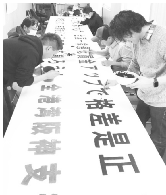
ブロック員で手作り作業

今年の春闘スローガンは例年の倍以上の文字になりました。毎年1日で作業が終わっていましたが、今年は2日間もかかりました。今年の横断幕の内容は「中小企業が儲ければ、全国一律最低賃金アップで格差是正！景気回復で『笑顔あふれる未来』を創ろう！」「家族や未来のため過労死に繋がる長時間労働を是正させ、人間らしく生活できる賃金を目指そう！」「くるった社