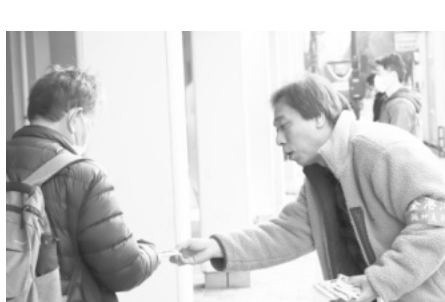
元町駅頭でビラを配布

春闘時期に支部独自の運動である「見える・聞こえる」春闘宣伝行動を大阪・神戸の駅頭で展開しています。第1回を3月2日、2回目を3月23日に行いま