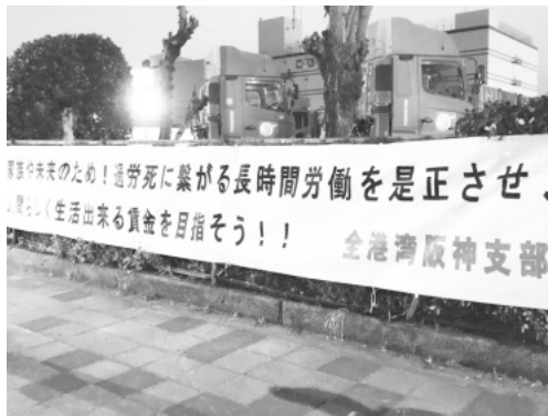
サントラ前で掲示

大阪ブロックは2月22・29日の2日間にかけて「20春闘」に向けて横断幕作成を行いました。