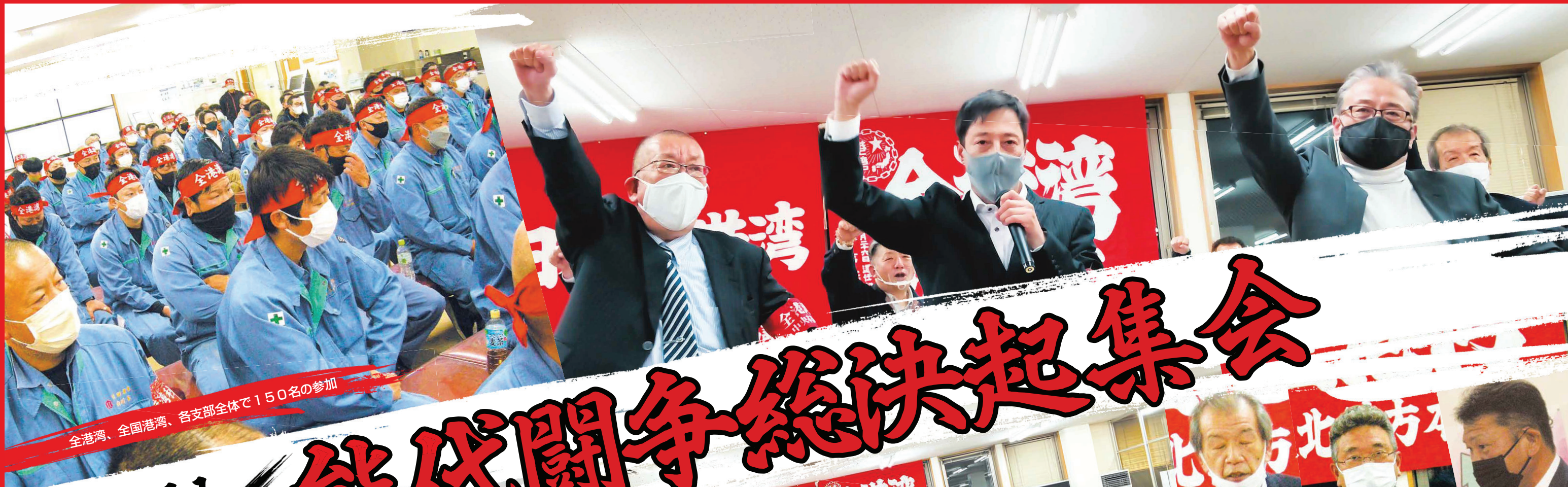
全港湾、全国港湾、各支部全体で150名の参加