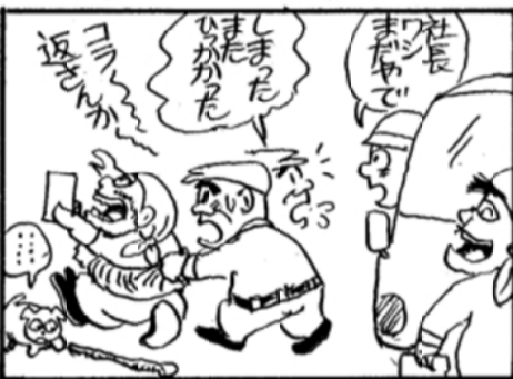
これがカマヤンがいつまでも地下タビ姿でいる理由カモ