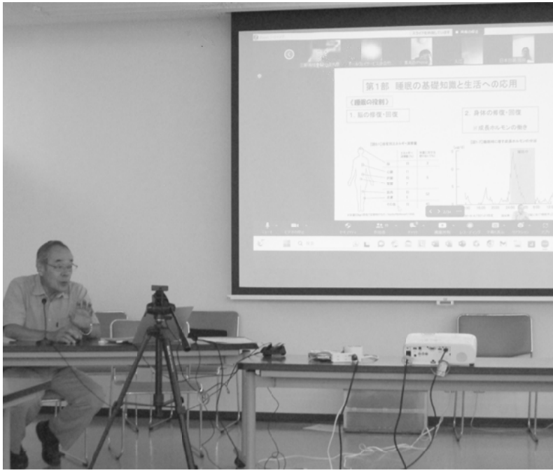
ZOOM配信で資料も使って分かりやすく解説

の約2割も消費するため、脳を回復するためには成長ホルモンであるメラトニンの分泌がもつとも高い午前0時〜午前8時の間に睡眠をとることが望ましく、また、睡眠時間は短すぎても長すぎても死亡リスクが伴うため、個人差はあるが6時間半が理想である」と説明されました。