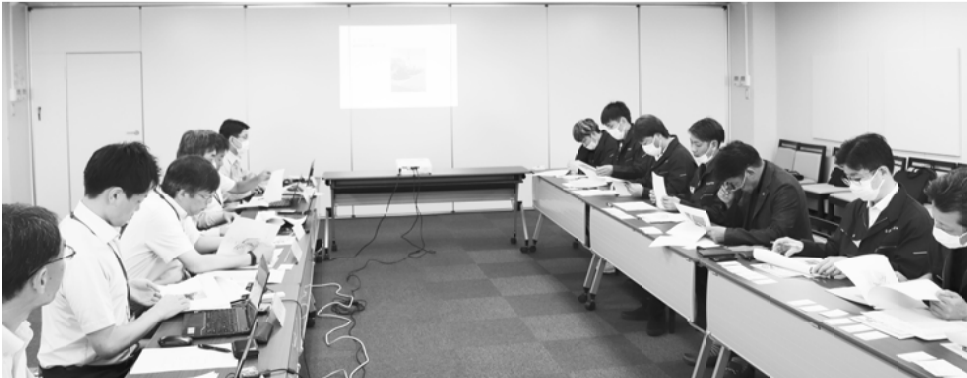
映像や資料を使って改善箇所を話し合う様子

一方、継続課題もあり、引き続き改善に向けて粘り強く運動を進めていきます。しかし、残念ながら、その場所に看板などを立て、全港湾の活