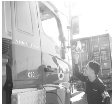
ドライバーへの宣伝行動

加えて、整備局担当者を支部に招いて、特殊車両通行許可の問題や、年々コンテナの重量が重くなっている