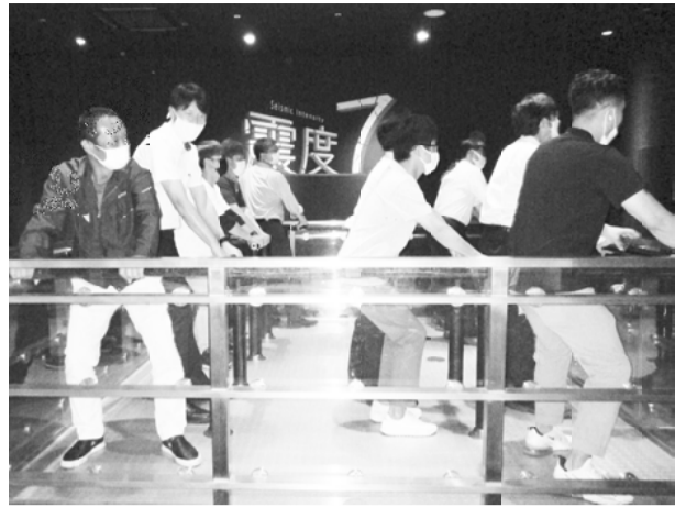
シュミレーターで震度7を体感

めて学ぶとともに、実際に災害に直面した時にどのような行動をとるべきなのかを学習しました。地震発生直後は自身を守る事を最優先とし、その後には家族や友人、同僚の安全を確保することが重要であると