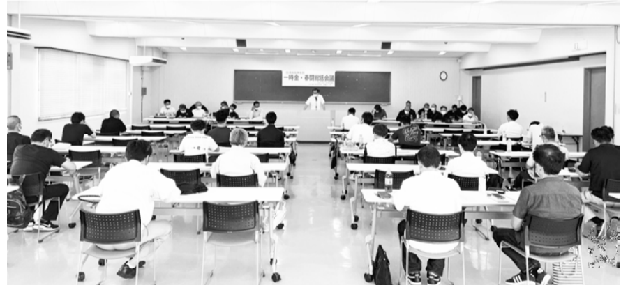
各分會の代表者が参加