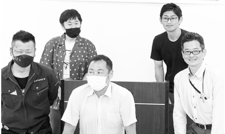
今総会で新体制となった三四労の事務局（一番左）副会長となった池口執行委員