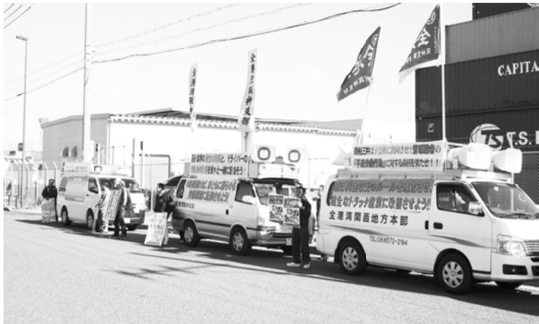
部会を中心に組織拡大宣伝行動

近年では中央本部の運動方針に基づき、近畿運輸局・整備局・大阪労働局にそれぞれ要請行動を年一回行っており、中央本部要請行動に反映させる運動を行っています。