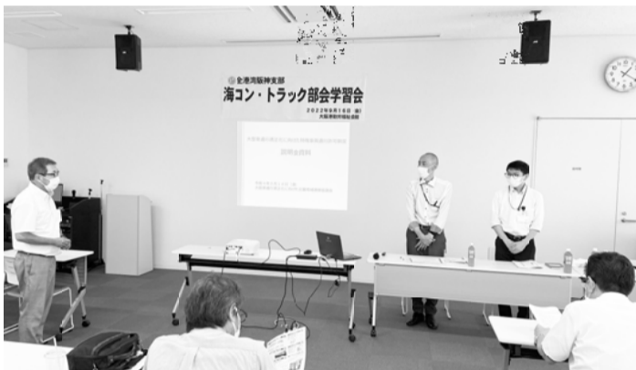
部会主催の学習会の様子

こと等を指摘したり、道路の老朽化、特に橋梁部に関しては早急に補修をするように促すなど意見交換の場を設けています。