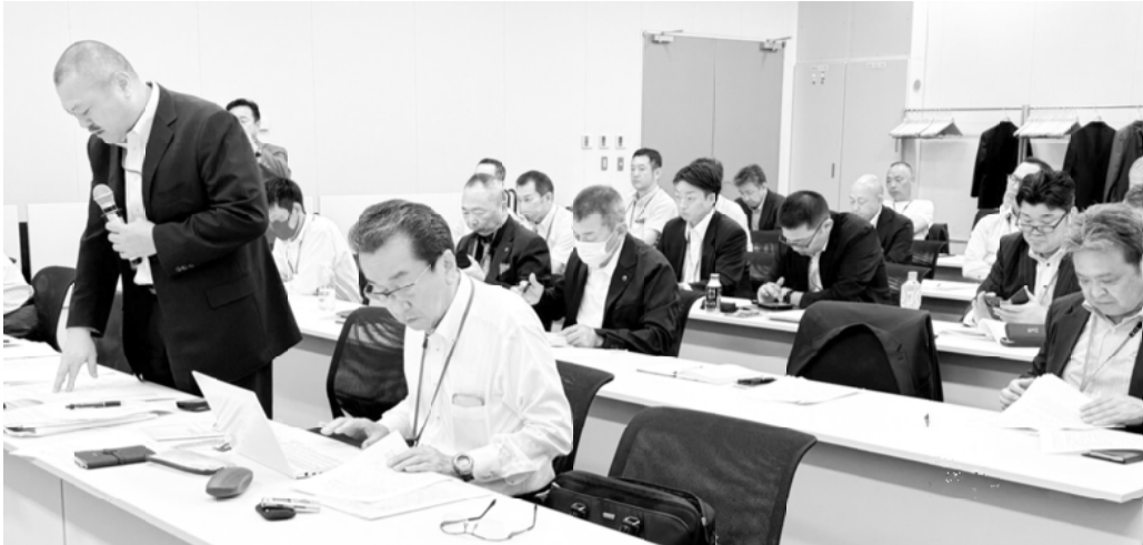
国土交通省への要請

道路交通法の改正では主に自転車運転の安全確保の観点から創設したことに就いて、我われドライバーにとって無謀な自転車運転は重大事故につながるなりやすいとの認識の下での改正であると感じました。