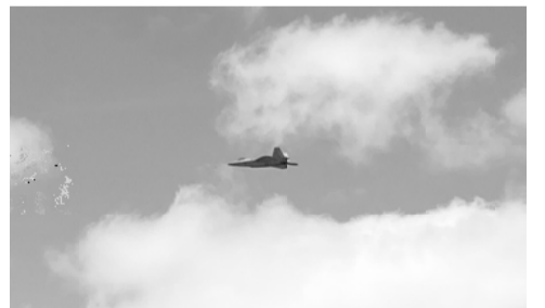
低空飛行の戦闘機 嘉手納基地

の問題だと理解しました。今回の平和行進を通じて感じたことは、沖縄県の本土復帰から52年が経過した今でも、本当の意味での本土復帰とは言えない現状があるということです。