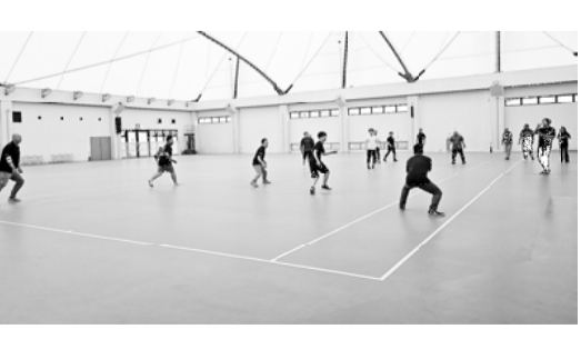
委員長も参加したドッチボール