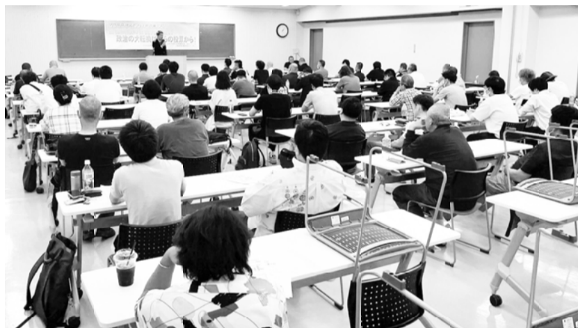
引き込まれるように聞き入る参加者

こと。派遣、非正規雇用をなくし同一労働同一賃金の構築。もう1つは最低賃金を上げること。イギリスでは物価の上昇に伴い最低賃金を10%上げ、フランスでは物価が上がれば最低賃金も上がる法律がある」と話され、「日本は物価が上がっても最低賃金が上がらない。いかに日本は世界でも賃金が安く劣っているか。日本も早く最低賃金を1500円以上に上げ、物価高に似合った暮らしができるように訴えていかなければならない」と力説されました。