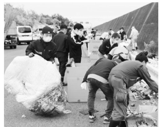
布団が捨てられていました

「監視カメラやネット配信により社名まで特定できず、警察も取り締り強化の方針を打ち出した。行政には徹底した管 元副委員長は、過酷な作業に劳いの言葉をかけたあと「監視カメラやネット配信により社名まで特定できず、警察も取り締り強化の方針を打ち出した。行政には徹底した管 元副委員長は、過酷な作業に劳いの言葉をかけたあと「監視カメラやネット配信により社名まで特定できず、警察も取り締り強化の方針を打ち出した。行政には徹底した管