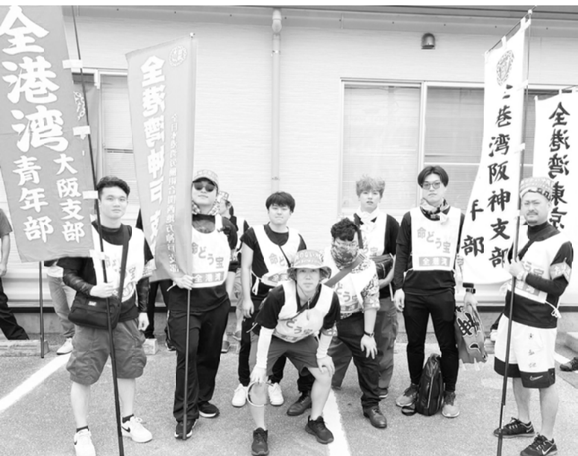
関西地方から参加した青年部メンバー

嘉手納基地でも、地鳴りのような爆音で6機の戦闘機がピストンで地上を飛び回り、下から見ていたら、ドローンで飛行機飛ばして遊んでいるみたいでした、アメリカに見くびられていてはつきりと感じました。