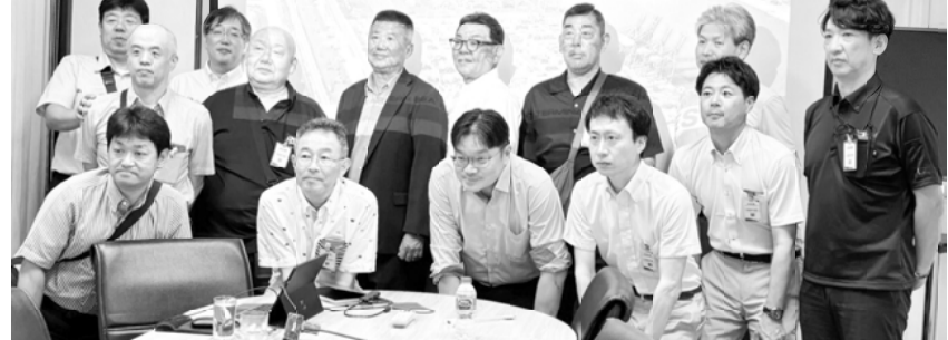
参加した委員会のメンバー

また、ラッカバンICDで聞いていた鉄道輸送に関しては、お国事情があるのかわかりませんが、鉄道発着時間が正確ではないらしく、貨物輸送の割合はトラックが7割、鉄道は3割であると聞きました。改めてトラック輸送の重要性を感じました。