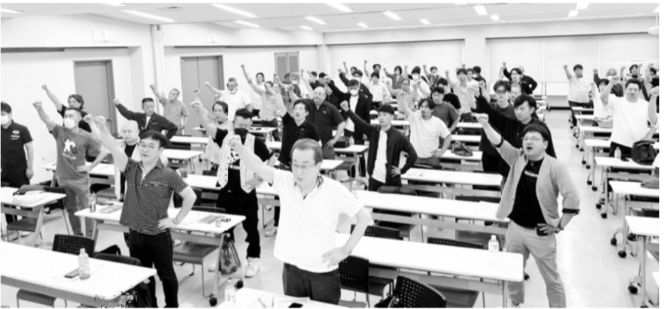
政治と暮らしを変えるため、団結ガンバロー！

講義の内容も分かりやすく、終始笑いを誘うまさに元芸人ならではの話し方で有意義な学習ができました。最後に松本副委員長の団結ガンバ