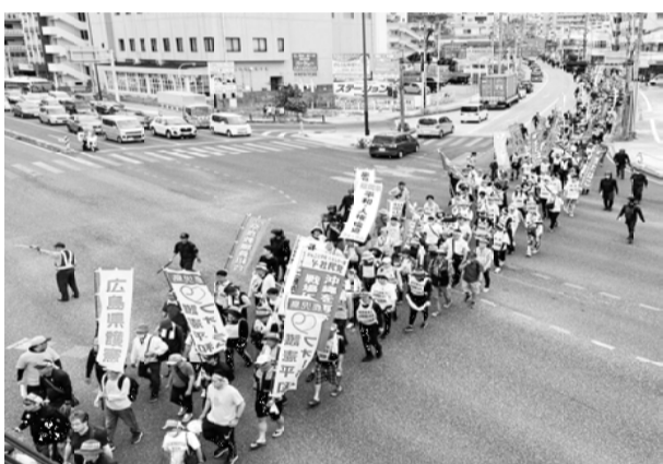
大勢の参加者で長い列を成す平和行進団

私たちは南コースを歩き、途中で2004年8月にアメリカ軍普天間基地所属のヘリコプターが沖縄国際大学1号館に墜落した事故現場を通りました。事故の爪跡を残すモニュメントがあり、その悲惨さと恐怖を感じました。この事故で大きな問題となったのが事