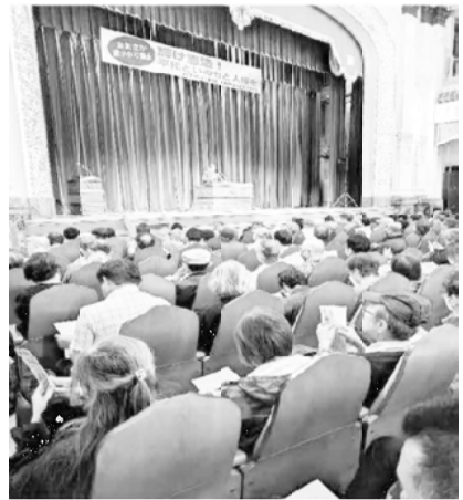
会場には1200人が集まった

11月3日、大阪 市中央公会堂にて 「輝け憲法！平和 といのちと人権を おおさか総がかり 集会」が開催さ れ、阪神支部から 執行部7名、8分 会15名が参加しま した。