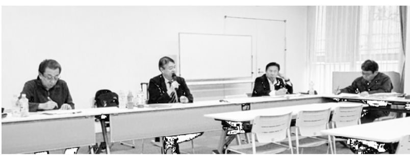
旅客対策会議の様子

はじめに担当中執で部会長の河野中執より「旅客関係の分会は関西にしかないのですが、来春の行政交渉はトラック・海コン部会と合同で行う」と報告し「安全・安心」の職場環境や賃上げの面では当然同じ取り組みをしていくべきであるし、旅客特有の課題についても