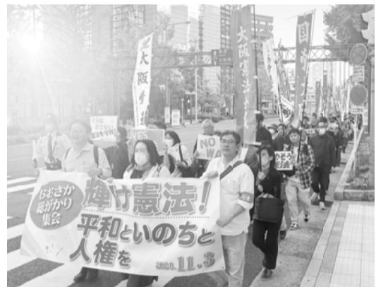
集会後に西梅田まで市民パレード