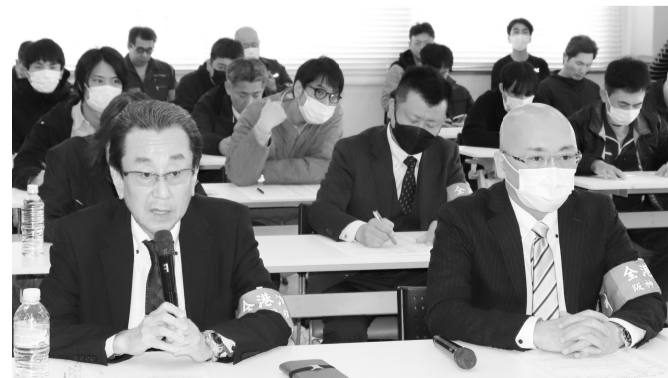
さらなる上積みへ誠意ある回答を求める