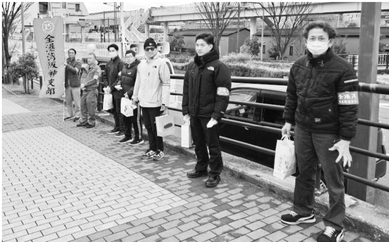
南港ATC前で宣伝行動を行うブロック員

の配布と街頭演説による阪神支部としての要求や活動内容を広くアピールする場として旺盛に行われまし た。 国民生活を大きく支える基幹産業でありながら、港湾では低賃金、長時間労働、就労時間の波動性などを理由に、人手不足が大きい