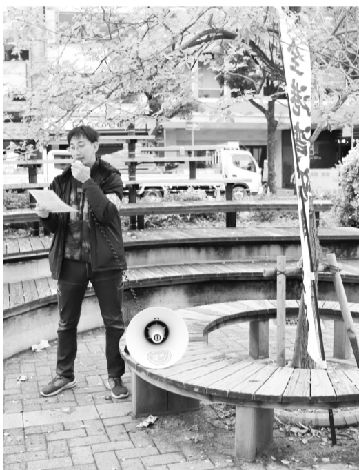
元町駅前 マイクで春闘アピール

例年春闘時に3回行っていた見える・聞こえる春闘早期宣伝行動を今年は5回に増やしてアピールを強化しました。 まずは2月26日と3月13日の2日間、神戸地区の主要拠点であるJR元町駅前(東口・西口)、三宮マルイ前、そして神戸市役所前の計4か所において在神執行部・分会員で宣伝行動を実施しました。 両日ともまだ肌寒さを