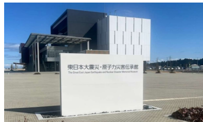
▲東日本大震災・原子力災害伝承館

実際にフィールドワークを行い震災の被害の受けた地域を見ることでニュースやインターネットの情報だけでは分からない現実を知る事ができました。